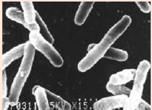
冷却水より収集したレジオネラ属菌