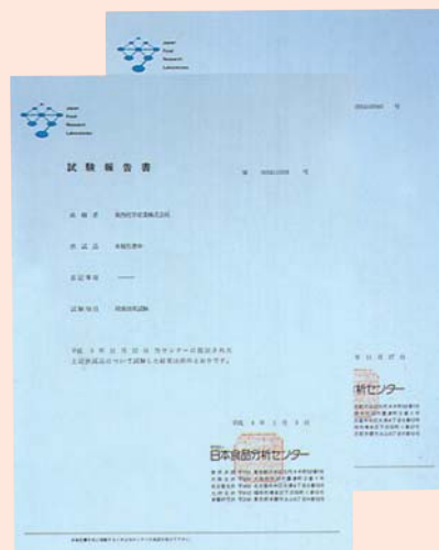
レジオネラ属菌に対する殺菌効果確認試験結果

仕様及びデザインは、改良等のため予告なしに変更する場合がありますので予めご了承ください。